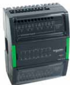
UI-16 16 универсальных входов

Сервер автоматизации поддерживает широкий спектр модулей ввода/вывода. Разнообразие доступных модулей обеспечивает необходимую комбинацию точек ввода-вывода для любого проекта и снижает стоимость решения для наших клиентов. Часть модулей поставляется с переключателями НОА (ручное управление/выключено/автоматическое управление) для принудительного ручного управления выходами.