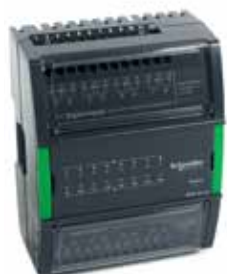
DI-16 16 цифровых входов