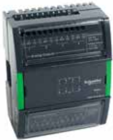
UI-8/AO-4, UI-8/AO-4-H 8 универсальных входов и 4 аналоговых выхода