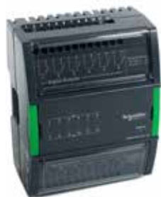
DO-FA-12, DO-FA-12-Н 12 цифровых выходов реле с замыкающим контактом (тип А)