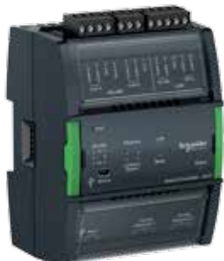
Сервер SmartX Edge AS-P

Сервер SmartX Edge AS-P представляет собой сервер EcoStruxure на уровне границы сети архитектуры. Благодаря высокой производительности сервер AS-P упрощает интеграцию и миграцию системы и является предпочтительным решением для крупных и сложных применений масштаба предприятий.