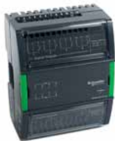
DO-FC-8, DO-FC-8-Н 8 цифровых выходов реле с переключающим контактом (тип С)