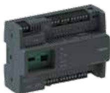
Сетевой контроллер SmartX IP MP-C

Серия MP, первая в предложении сетевых контроллеров SmartX IP, разработана для установок с переменным расходом воздуха и фанкойлов, тепловых насосов, крышных блоков и вентустановок. Эти контроллеры поддерживают расширяемые гибкие архитектуры, обеспечивающие сбор данных от подключенного оборудования и расширение возможностей по диагностике и устранению проблем. Возможен ввод в эксплуатацию с мобильных устройств мобильном приложении eCommission SmartX IP Controller.