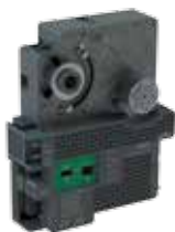
Контроллер SmartX MP-V

Примечание. Используются клеммы с винтовыми зажимами. Запасные части доступны. См. раздел «Принадлежности» на стр. S6.