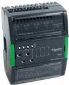
UI-8/AO-V-4, UI-8/AO-V-4-H 8 универсальных входов и 4 выхода напряжения (на фото UI-8/AO-V-4-H)