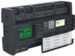
Сервер SmartX Edge AS-B

Сервер SmartX Edge AS-B представляет собой компактную систему BMS «все в одном». Этот сервер характеризуется встроенными универсальными точками ввода/вывода и источником питания. Сервер EcoStruxure с его компактным дизайном идеально подходит для приложений небольшого и среднего масштаба. Использование этого сервера обеспечивает снижение затрат на установку.