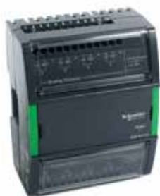
АО-V-8, АО-V-8-Н 8 аналоговых выходов напряжения