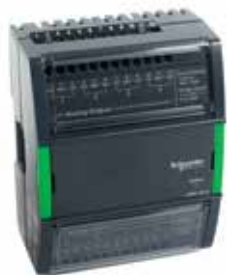
АО-8, АО-8-Н 8 аналоговых выходов