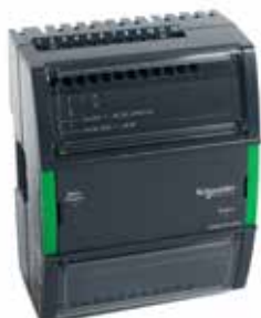
PS-24V Источник питания сервера автоматизации

PS-24V – это модуль источника питания с входным напряжением 24 В переменного тока или 24 В постоянного тока. Каждый модуль источника питания подает стабилизированное выходное напряжение 24 В постоянного тока на шину питания. Этот модуль источника питания может подавать питание на AS-P и на модули ввода/вывода в соответствии с таблицей потребляемой мощности (см. ниже). Если требуется большее количество модулей ввода/вывода, то к шине можно подключить еще один источник питания. Источники питания изолированы друг от друга и одновременно с этим обеспечивают сквозную передачу.