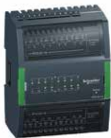
RTD-DI-16 16 RTD/цифровых входов