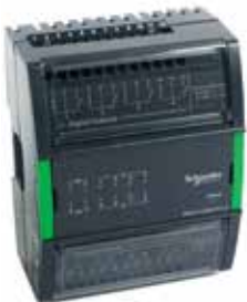
UI-8/DO-FC-4, UI-8/DO-FC-4-H 8 универсальных входов и 4 цифровых выхода реле с переключающим контактом (тип С)